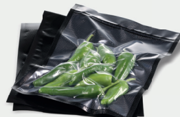
Schwarze strukturierte Vakuumbbeutel