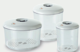
New-line Vakuumbehälter (rund)