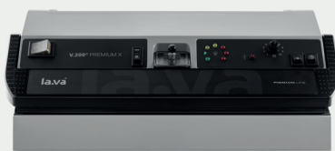
V.200 Premium X 2-fach Schweißnaht