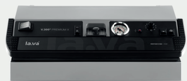
V.300 Premium X 2-fach Schweißnaht