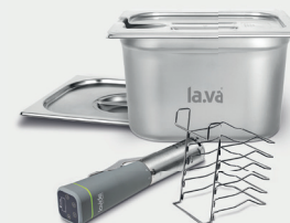
Sous-Vide-Set XXL Edelstahl