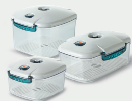
New-line Vakuumbehälter (eckig)