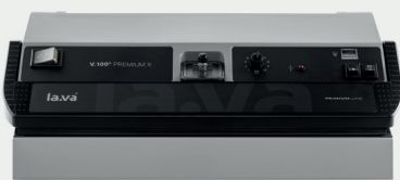
V.100 Premium X 2-fach Schweißnaht