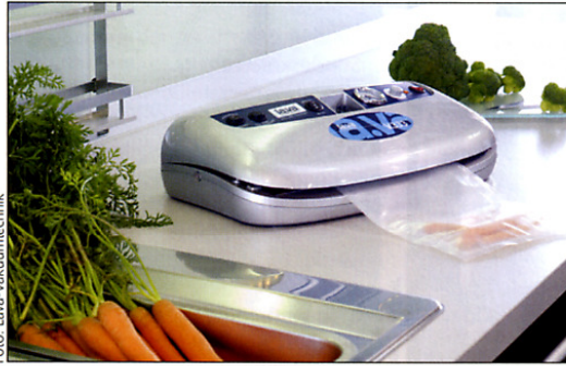
Eine saubere dritte Schweißnaht verspricht das Vakuumiergerät V.333.

Das Profi-Vakuumiergerät wird geliefert in einem Start-Set, bestehend aus dem Vakuumiergerät V.333, einer Absaugvorrichtung für Behälter, einem Set verschiedener Vakuumbeutel und einer ausführlichen Bedienungsanleitung. Es kostet 599 €. Weitere Informationen gibt es bei LAVA Vakuumverpackung, Valentinstraße 31-1, 88348 Bad Saulgau, Tel. (0 75 81) 21 08, Fax 58 06, E-Mail: verkauf@la-va.com, Internet: www.la-va.com.